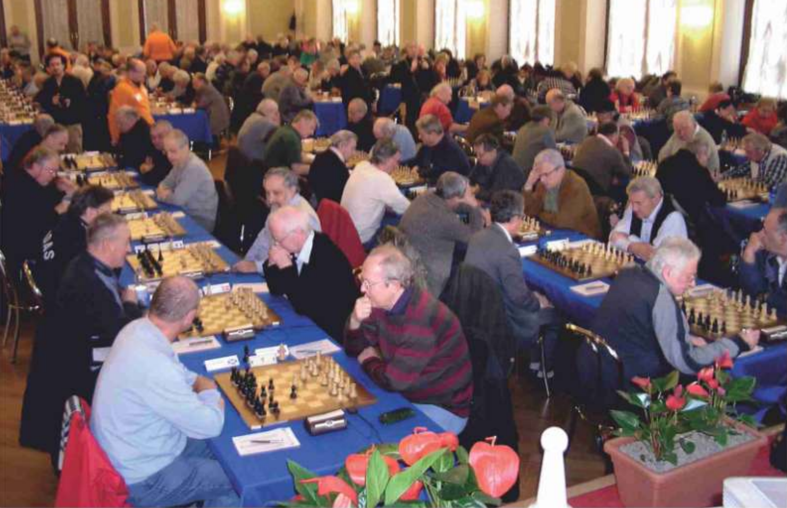
MS seniorov - zaplnená sála čaká na začiatok kola