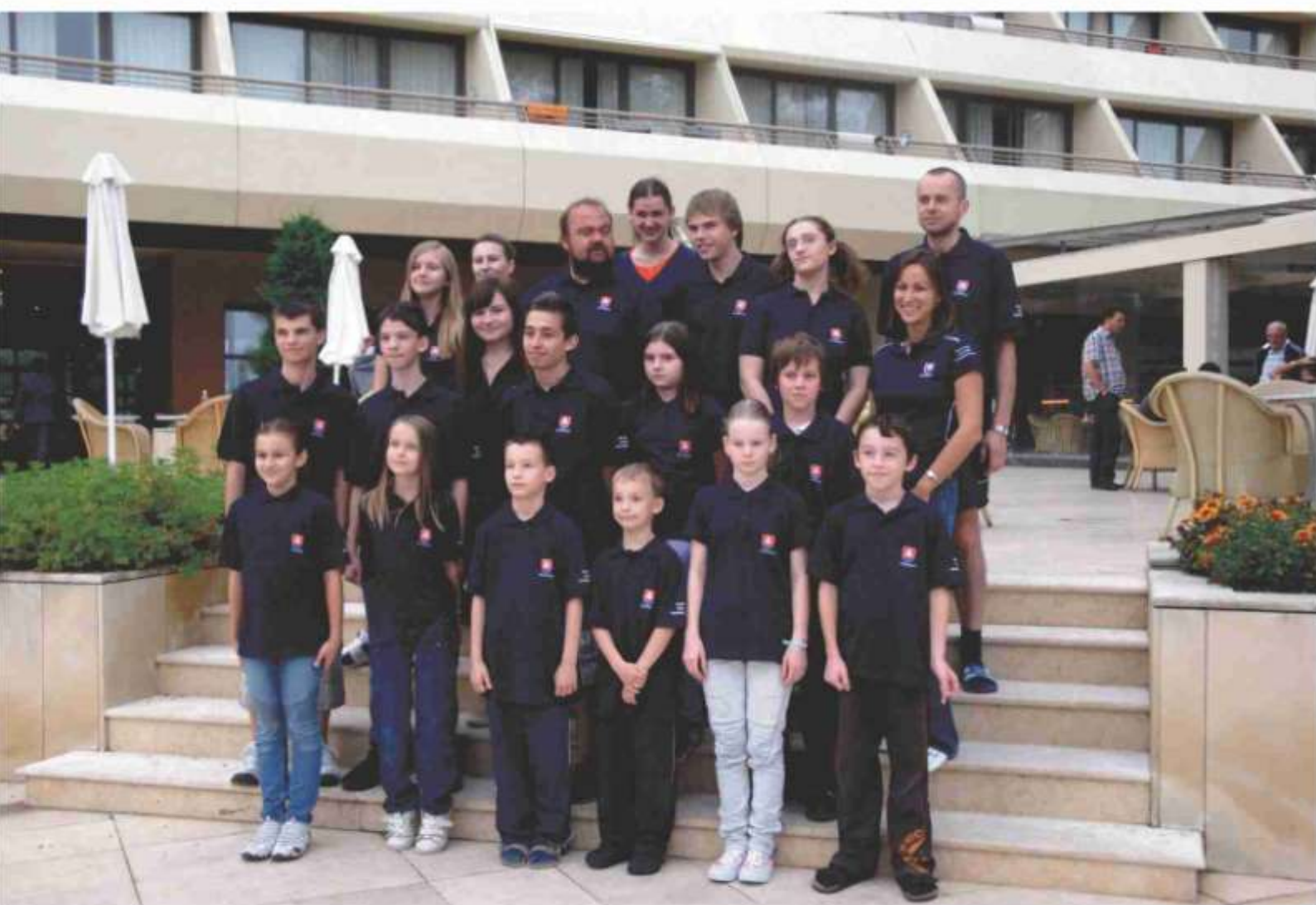
Slováci na MS mládeže s trénermi a vedúcou